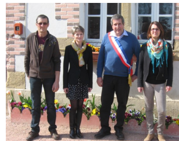
Le Maire et ses Adjoints