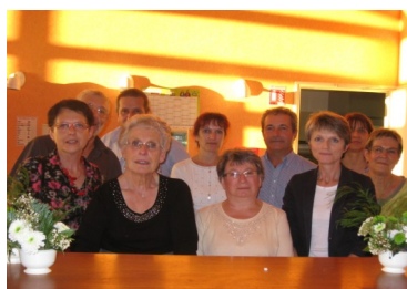
Les membres du CCAS