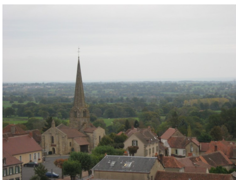
L'église Saint Martin vue du Château d'eau