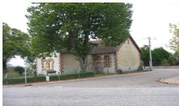
Le bâtiment de l'Association St Martin