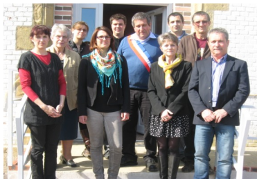
Le Conseil municipal (S.Casciario absent sur la photo)