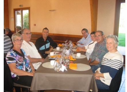
Et rien de mieux que le soleil et la convivialité pour passer une agréable journée...où les discussions, les rires et la musique se sont mêlés..