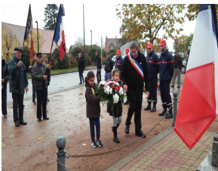
Le 11 novembre, cérémonie de commémoration au monument aux morts, les enfants apprennent aussi à se souvenir..