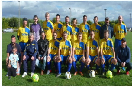
C'est la rentrée sportive, et l'Union Sportive Saulcet-Le Theil est prête pour la nouvelle saison avec son équipe A en départementale 2 (poule D)....