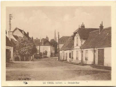
Le Theil bien avant...