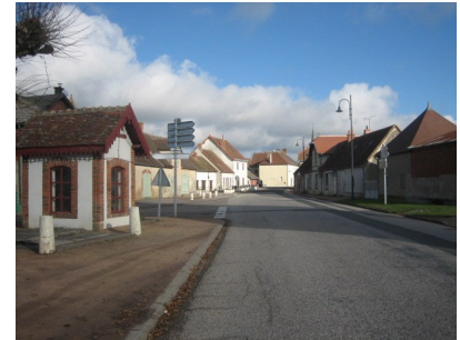
Le Theil maintenant