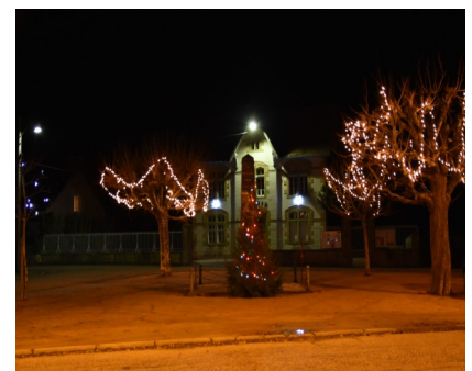
Revoilà les guirlandes et les illuminations : Noël est bientôt là et la nouvelle année aussi...Joyeuses fêtes à tous et à l'année prochaine.....