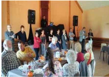
Le 14 octobre, les membres du CCAS sont à pied d'œuvre pour recevoir les Aînés du Theil à la salle des Moulins...