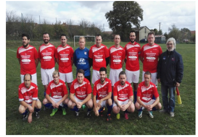
....son équipe B en départementale 5 (poule C)....