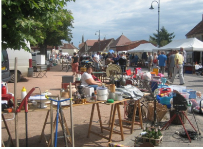
...et les visiteurs ont agréablement profité de cette journée, jusqu'à ce que l'orage vienne jouer les trouble-fête...