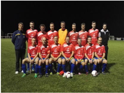
...et son équipe C également en départementale 5 (poule D)...Voilà de quoi briller dans le championnat et autre coupe d'Allier....