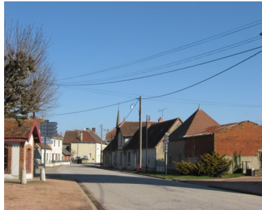
Le Theil avant.....