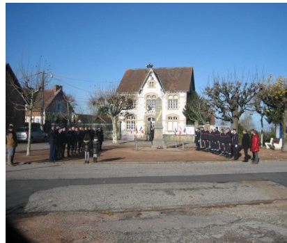
Le 26 novembre : Ste Barbe et hommage aux sapeurs pompiers disparus, avant une remise de médailles à la salle des Moulins..