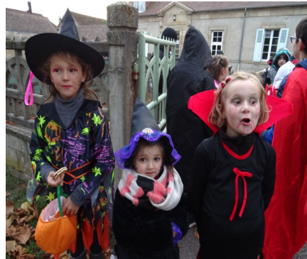
Et le 8 novembre, c'est parti pour un Halloween de folie, avec des monstres tous plus beaux les uns que les autres....