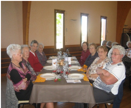
...permettant à chacun de mettre entre parenthèses les soucis du quotidien....