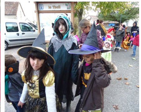
..et une récolte de friandises conséquente grâce à la générosité de tous ....